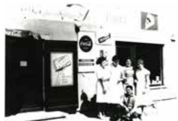
Janesch 1959

Die Frage nach dem höchsten Turm in München kann heute jeder leicht beantworten. Aber vor 50 Jahren? Laut Statistischem Handbuch von 1964 hat damals die Funkantenne beim Fernsehstudio Freimann mit 100 m den Frauentürmen (99 m) den Rang abgelassen. Auf diesen überraschenden Freimanner Rekord sind wir bei Recherchen für unseren nächsten Erzählabend gestoßen, bei dem das Leben in Freimann in den 1950er und 1960er Jahren Thema sein wird.