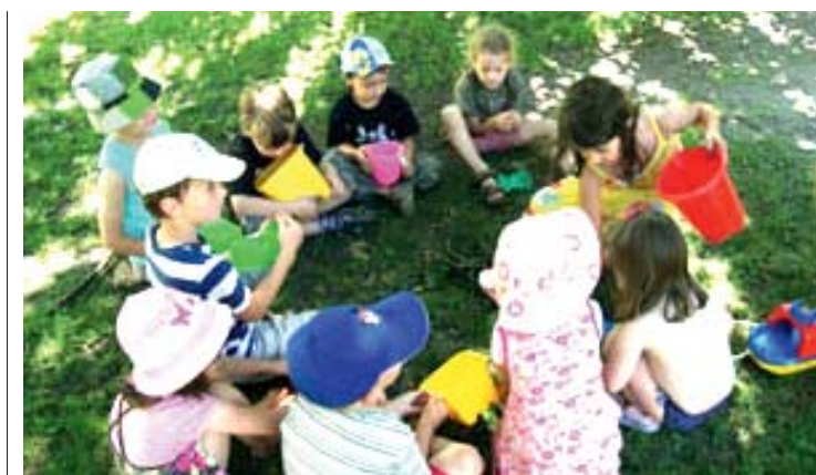
Die „Zwergel“ spielen jeden Tag im Garten der Villa - Dank der Eltern-Kind-Initiative Kiefernzwergel e.V. Tel: 089-324 15 00