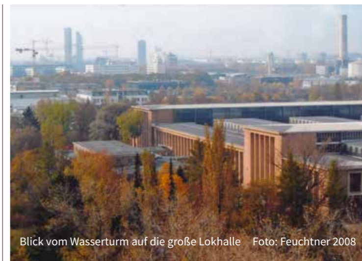
Blick vom Wasserturm auf die große Lokhalle

„Mohr-Villa Freimann“ erscheint jeden zweiten Monat. Newsletter: treffpunkt@mohr-villa.de Herausgeber: Mohr-Villa Freimann e.V. Vorsitzende: Brigitte Fingerle-Trischler Situlistraße 75 - 80939 München Telefon: 089 - 32 43 264 www.mohr-villa.de treffpunkt@mohr-villa.de Sprechzeiten: Mo - Fr, 11-16 Uhr und nach Vereinbarung Spendenkonto: Konto-Nr.: 7606028, BLZ.: 701 900 00, Münchner Bank e.G.