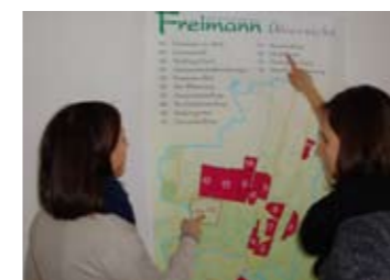
In der Ausstellung

Mit großem Interesse besuchten zahlreiche Freimanner die Ausstellung „Freimann und seine Siedlungen“. Mit Spaß und Freude wurde in Vergessenheit Geratenes wiedergefunden und Neues entdeckt. „Jetzt wissen wir, warum unsere Straße so heißt“, „sehr schön und informativ“, „Eine tolle Leistung!“, „Da macht es gleich Lust, auf Spurensuche zu gehen und Freimann neu zu entdecken“, sind nur ein paar der begeisterten Kommentare. Gerne nahmen die Besucher die Begleit-Broschüre mit nach Hause, um dort weiter auf Spurensuche gehen zu können.